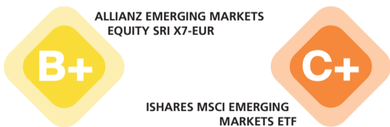
TABLEAU DE BORD DE LA FINANCE DURABLE

Deux ETF actions marchés émergents comparés par Conser - ESG Verifier. Et les indispensables de la finance durable, dont les sorties de capitaux qui frappent les fonds ESG. PAGE 12