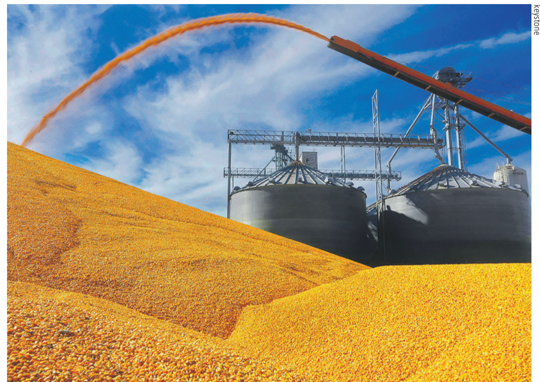
PIB. Les Etats-Unis (ici la production de maïs dans l'Illinois), longtemps attendus en récession, ont finalement terminé l'année en force, avec une croissance de 2,5%.

Mais la situation devrait être différente dans le reste du